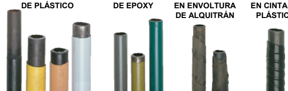
REVESTIMIENTOS PROTECTORES PARA TUBERÍAS DE ACERO

LA INFORMACIÓN PROPORCIONADA AQUÍ PUEDE NO SER TOTALMENTE INCLUSIVA. PARA PRÁCTICAS DE PREVENCIÓN DE DAÑOS POR EXCAVACIÓN E IDENTIFICACIÓN POSITIVA DE TUBERÍAS, CONTACTE A COLUMBIA GAS EN COLUMBIAGASPA.COM/EXCAVATORS .