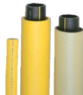
MATERIALES DE MANGA

LA TUBERÍA DE PLÁSTICO SE PUEDE INSERTAR EN MANGAS, CARCASA O TUBERÍA DE PLÁSTICO O DE ACERO